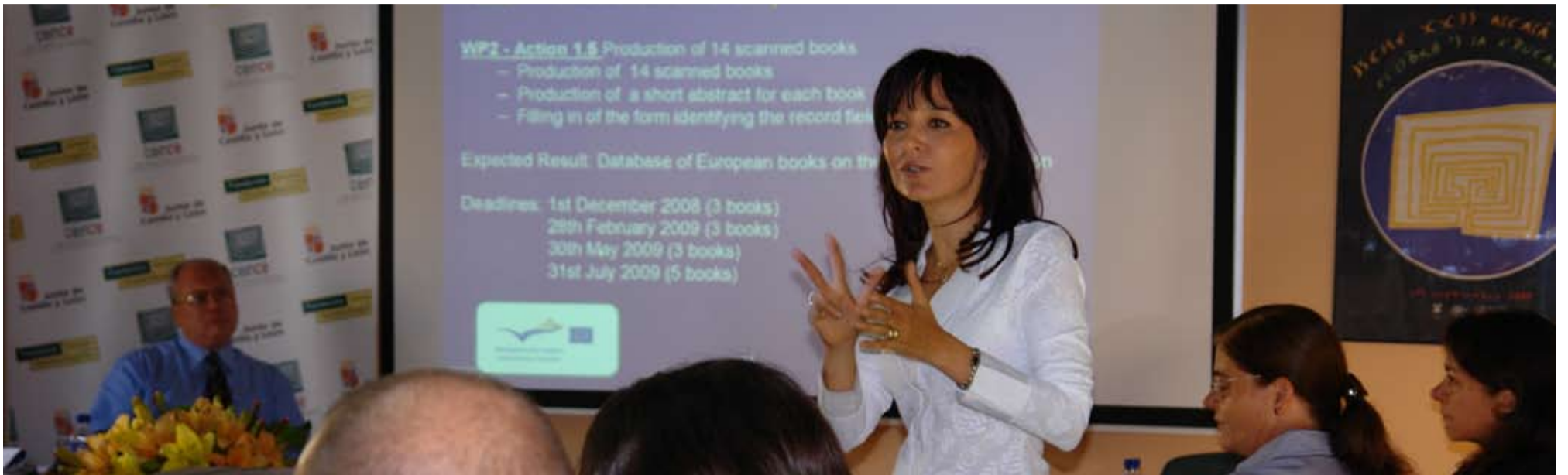
Sesión de trabajo del Coloquio Europeo History on Line Project

El catálogo Multiopac creará la red internacional de bases de manuales más importante de Europa