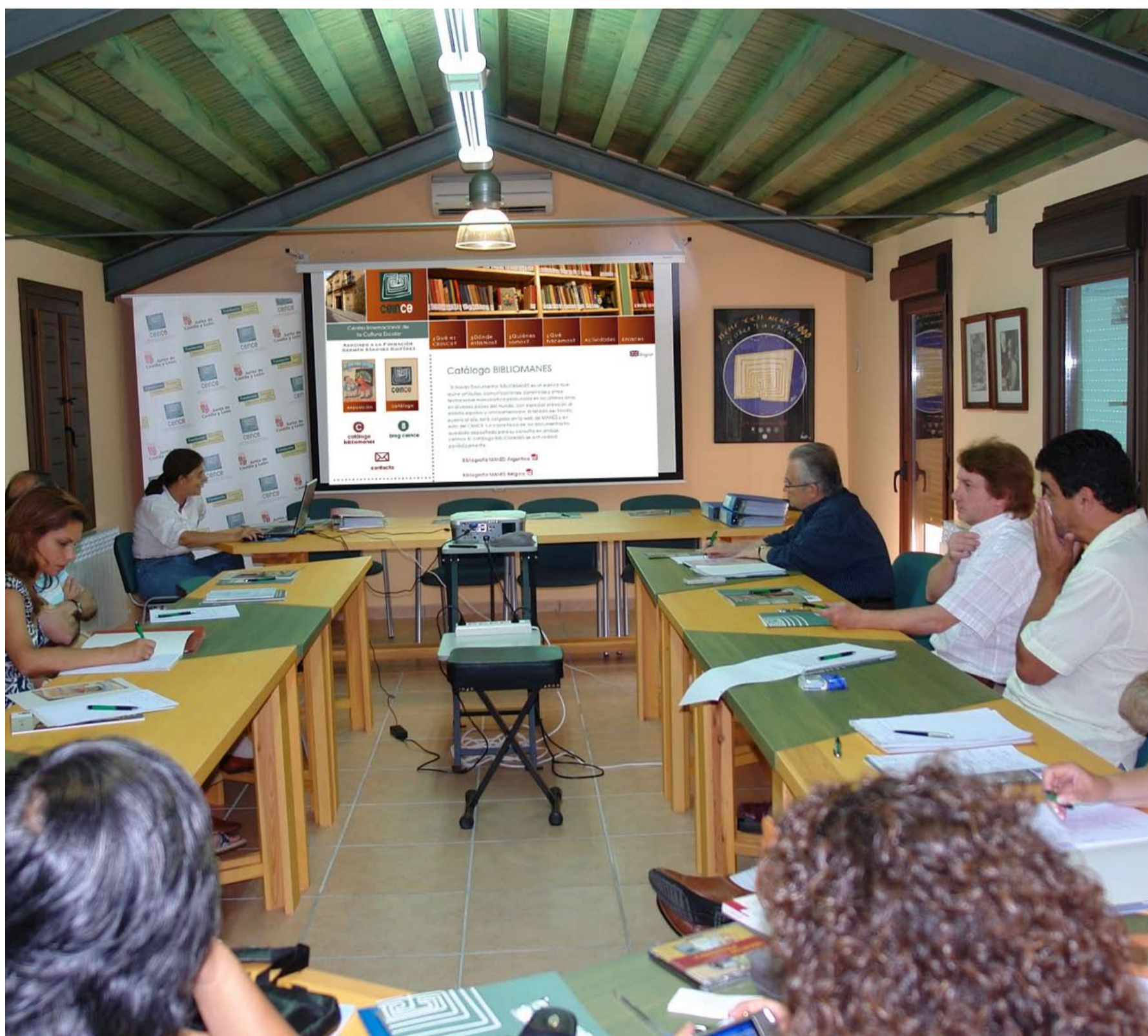
Presentación del Catálogo BIBIOMANES en el Aula Julián Sanz del Río del CEINCE

La producción académica en el sector de la manualística ha adquirido en los últimos años un importante volumen y una rica diversidad. El catálogo BIBIOMANES, archivo que reúne casi un millar de documentos impresos relativos a la materia, procedentes de los principales países de Europa y América con los que mantenemos contacto en este campo, se gestó en el seno del Centro MANES de la UNED. Hoy es una base de datos compartida entre esta institución y el CEINCE. Nuestra web muestra en la entrada un vínculo que da acceso directo al archivo.