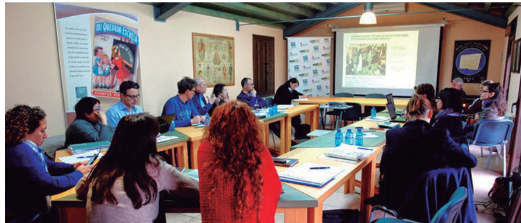
Sesión de trabajo del Simposio Internacional “Education in the periods of Political Transitions in Europe”.

En el evento participaron investigadores de España (UNED, Sevilla), Italia (Macerata, Campobasso, Torino), Portugal (Lisboa, Lusófona, Santarem) y Alemania (Instituto Eckert). Italia y Alemania representaban a países que tuvieron que remodelar sistemas y programas educativos a la salida de la Segunda Guerra Mundial. Portugal y España son países que a mediados los años setenta del pasado siglo transitaron desde sus respectivas dictaduras –vigentes largo tiempo– a nuevas formas democráticas de formación de la ciudadanía. Cada uno de estos países transformaron en la segunda mitad del siglo XX sus viejas estructuras educativas, siguiendo en ello diferentes modelos y procesos de cambio.