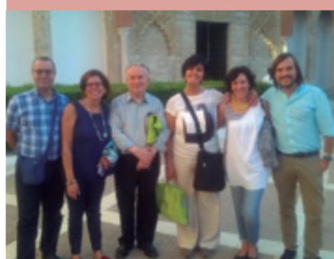
Foto de un grupo de profesores participantes --de Portugal, España e Italia, la Europa del Sur-- en el Simposio Internacional “School Memories”, celebrado en la Universidad de Sevilla a finales de septiembre de 2015, evento al que asistieron representantes de 19 países, varios de ellos nuevos en nuestros círculos académicos, como los que procedían de la antigua Europa del Este. Europa contiene diversas memorias y culturas, entre las que las que se encuentran las del Sur, las del Centro y las de la llamada Miteuropa.