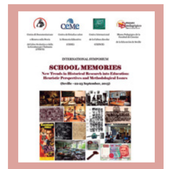
Portada del programa del Simposio School Memories.