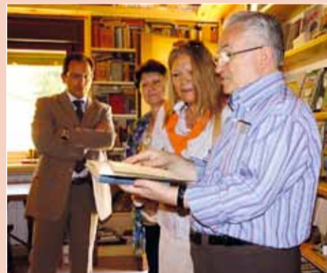
Equipo de gobierno de la UEMC

Directora del Seminario sobre Historia de la Educación en América, fundado hace más de treinta años en la Universidad de Salamanca. Es doctora honoris causa por la Universidad de Santo Domingo, la primada de América, creada en 1538. En su gestación intervino fray Tomás de Berlanga, provincial años antes del convento de los dominicos en La Española.